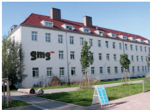
Sede principal de GMG en Tübinga (Alemania)

Nuestro objetivo, sin embargo, no se circunscribe sólo al apoyo y al cumplimiento de las normas de todos los estándares industriales más comunes. Para GMG es importante alcanzar un estándar más elevado que el especificado por las diversas organizaciones. Consideramos como nuestro cometido el fomento activo a nivel global de la filosofía ‘estándar’, es decir, de la producción de impresos y la realización de pruebas de impresión siguiendo unos estándares industriales. Además, nos hemos propuesto conseguir la máxima vinculación posible en materia de colores. Nuestra cartera de productos actual es un reflejo claro de estos planteamientos. Con lo conseguido, sin embargo, aún no estamos satisfechos. Nuestra cartera de productos actual es un claro reflejo de este afán. Pero lo que hemos conseguido hasta ahora no nos hace estar satisfechos. Por este motivo trabajamos de forma permanente en perfeccionar nuestros productos para poder ofrecer a nuestros clientes de la industria gráfica soluciones completas para la estandarización y simplificación de los flujos de trabajo para la gestión del color, desde la idea inicial hasta el producto impreso acabado.